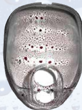
Линза с покрытием Scotchgard®

** Прим.: В зависимости от условий применения и частоты очистки, срок службы покрытия Scotchgard® может меняться.